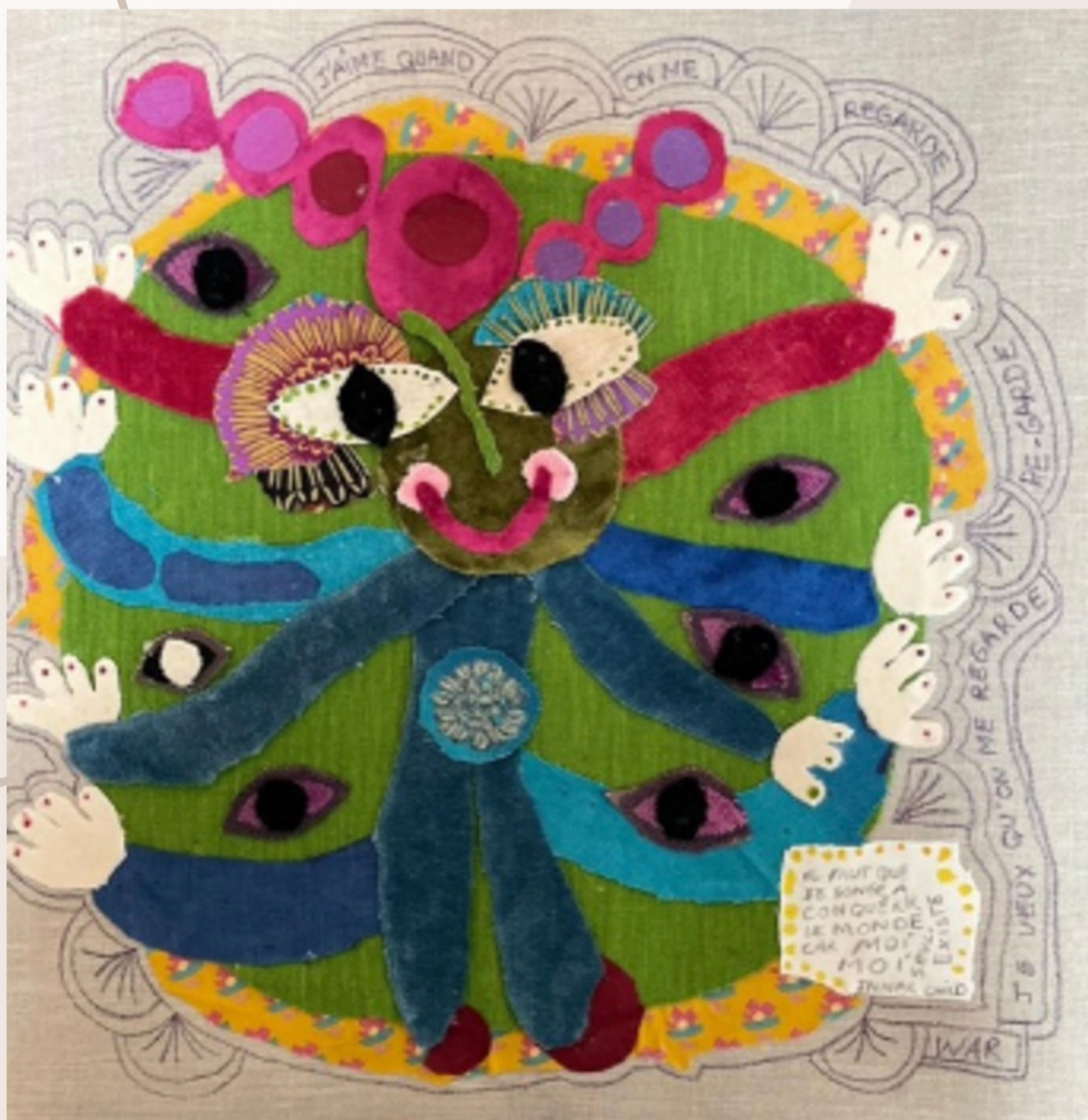
La conquête du Moi - 2022 Série : les corps psychiques Assemblages textiles et écritures sur toile de lin 50x50 cm