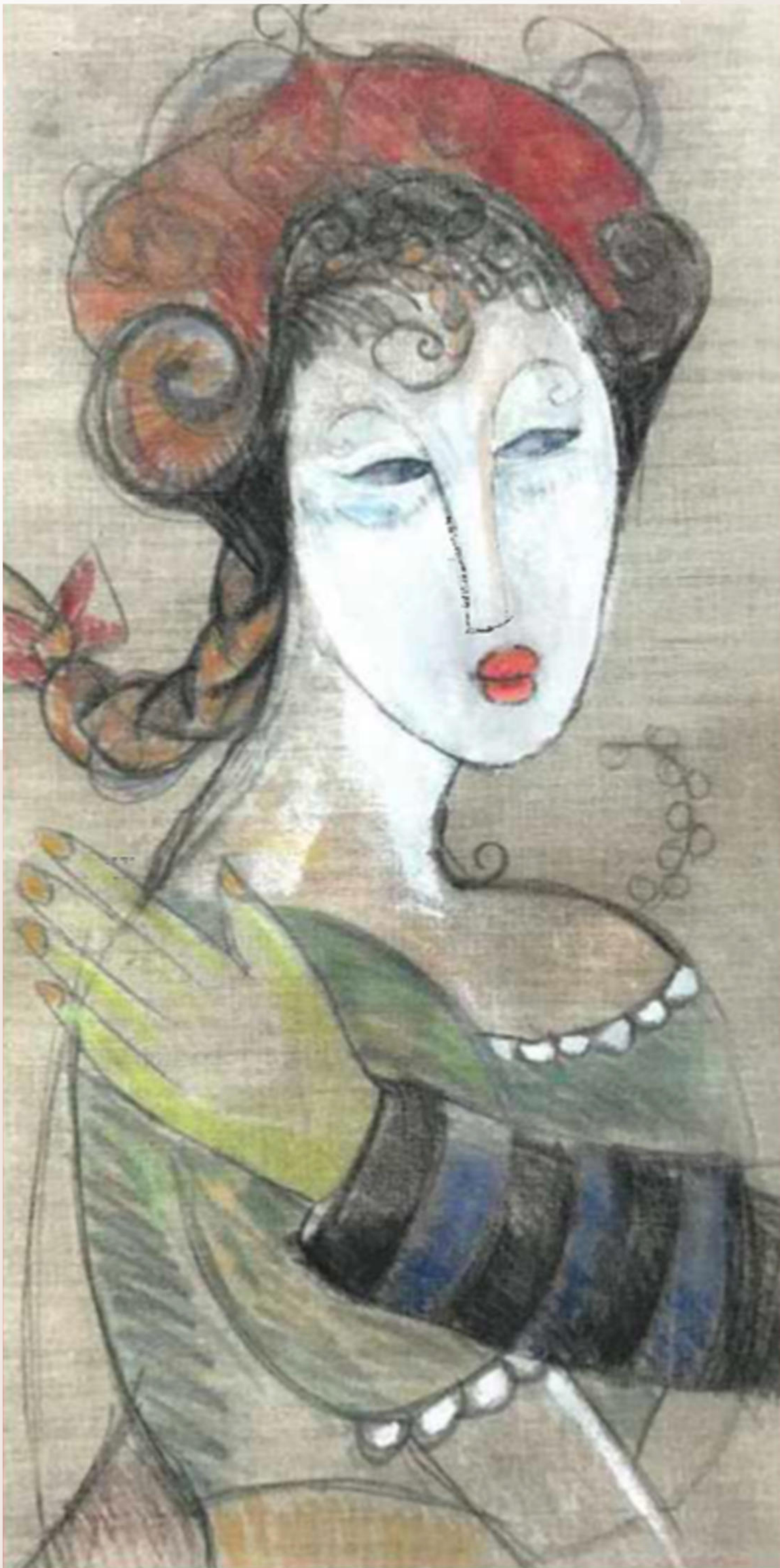
La Reine Margot - 1994 Pastel sec sur toile de lin 40x70 cm