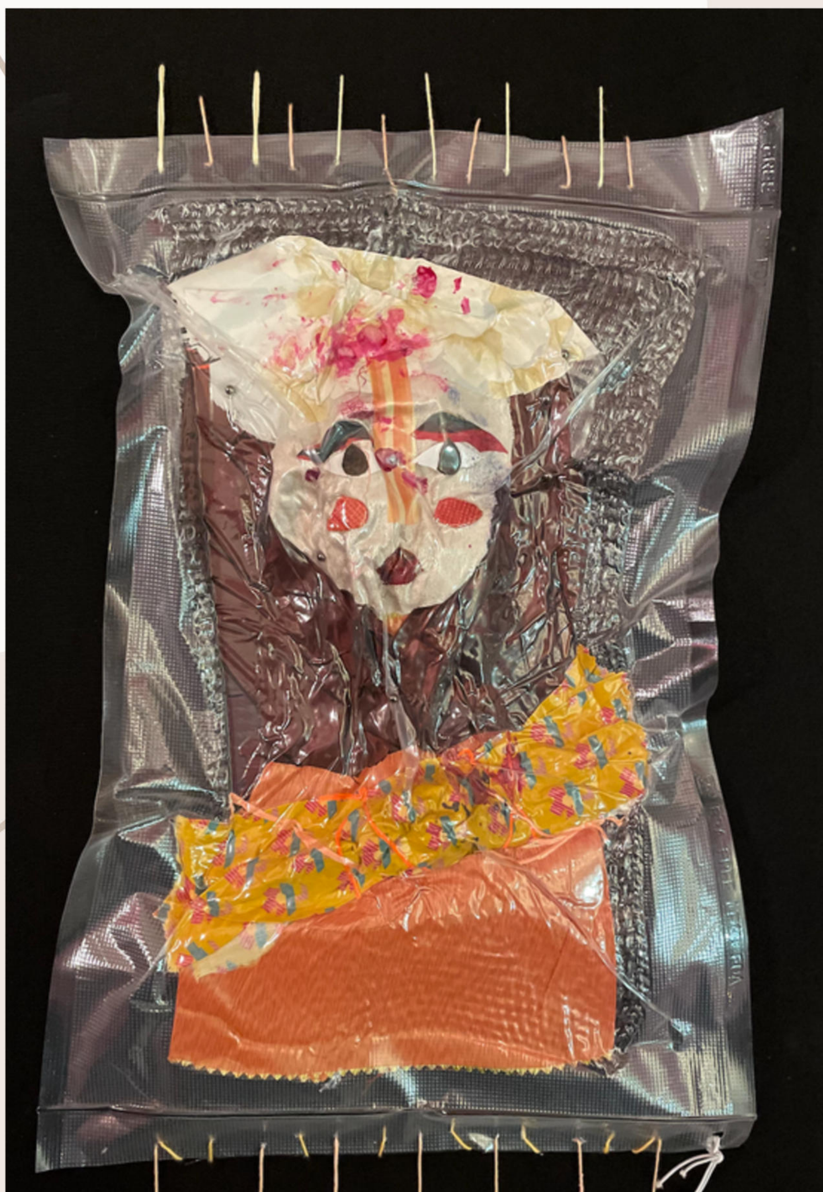
Opressed woman -2025 Femmes opprimées sous vide 30x40 cm