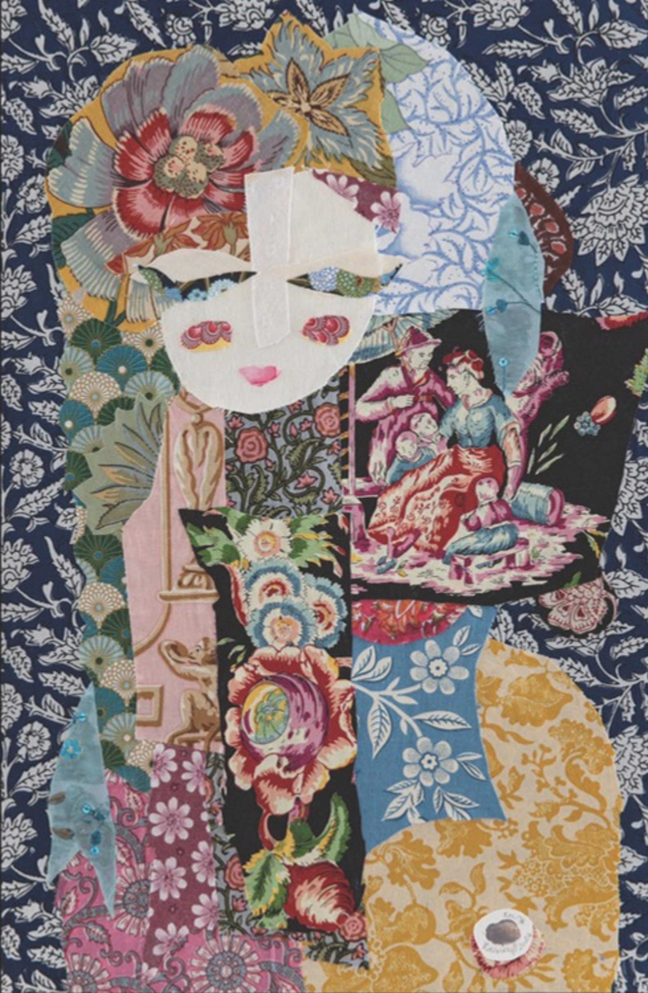
Le Jardin la nuit - 2024 Assemblages textiles et techniques mixtes 40x60cm