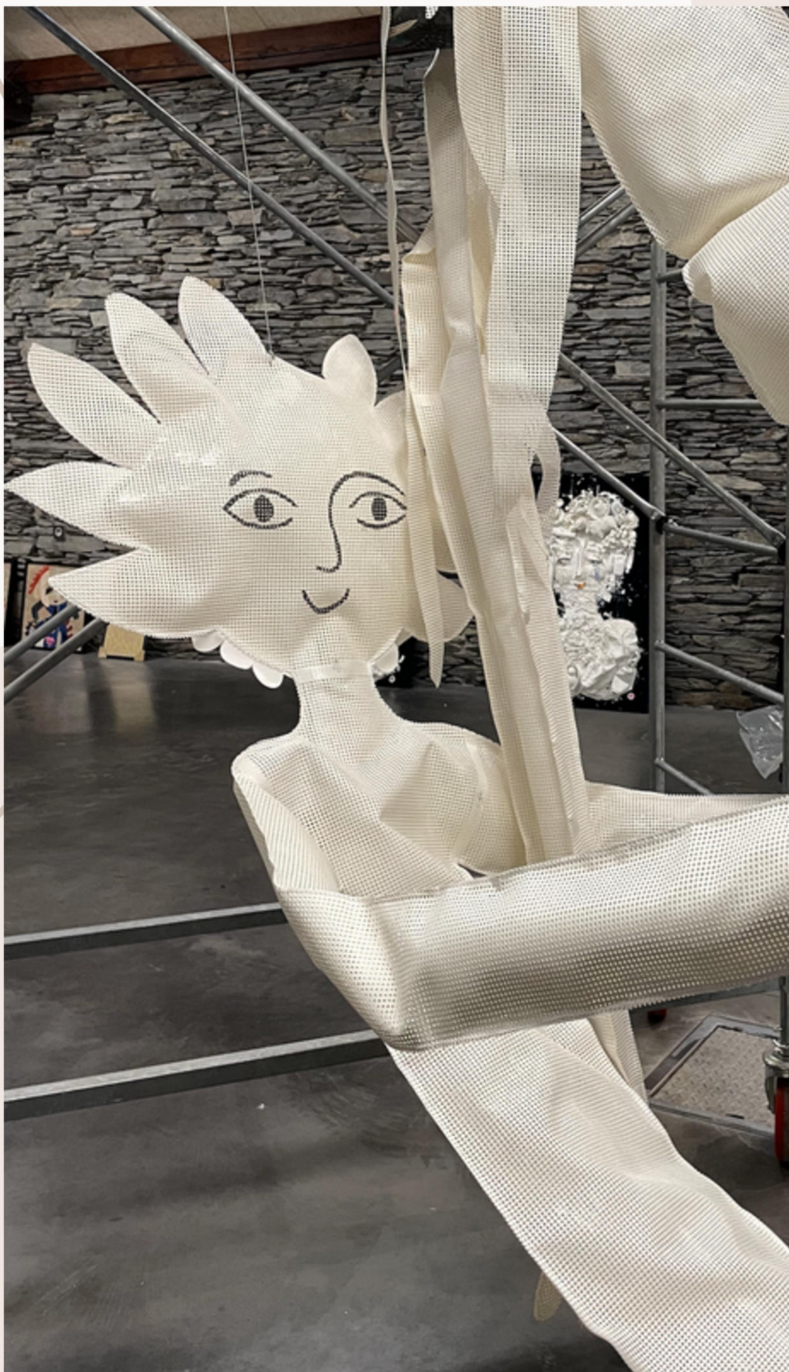
Figurines en cours d'installation - 2026 Bâches textiles - récupération Longueur 5 mètres - Partenaire : Sofareb