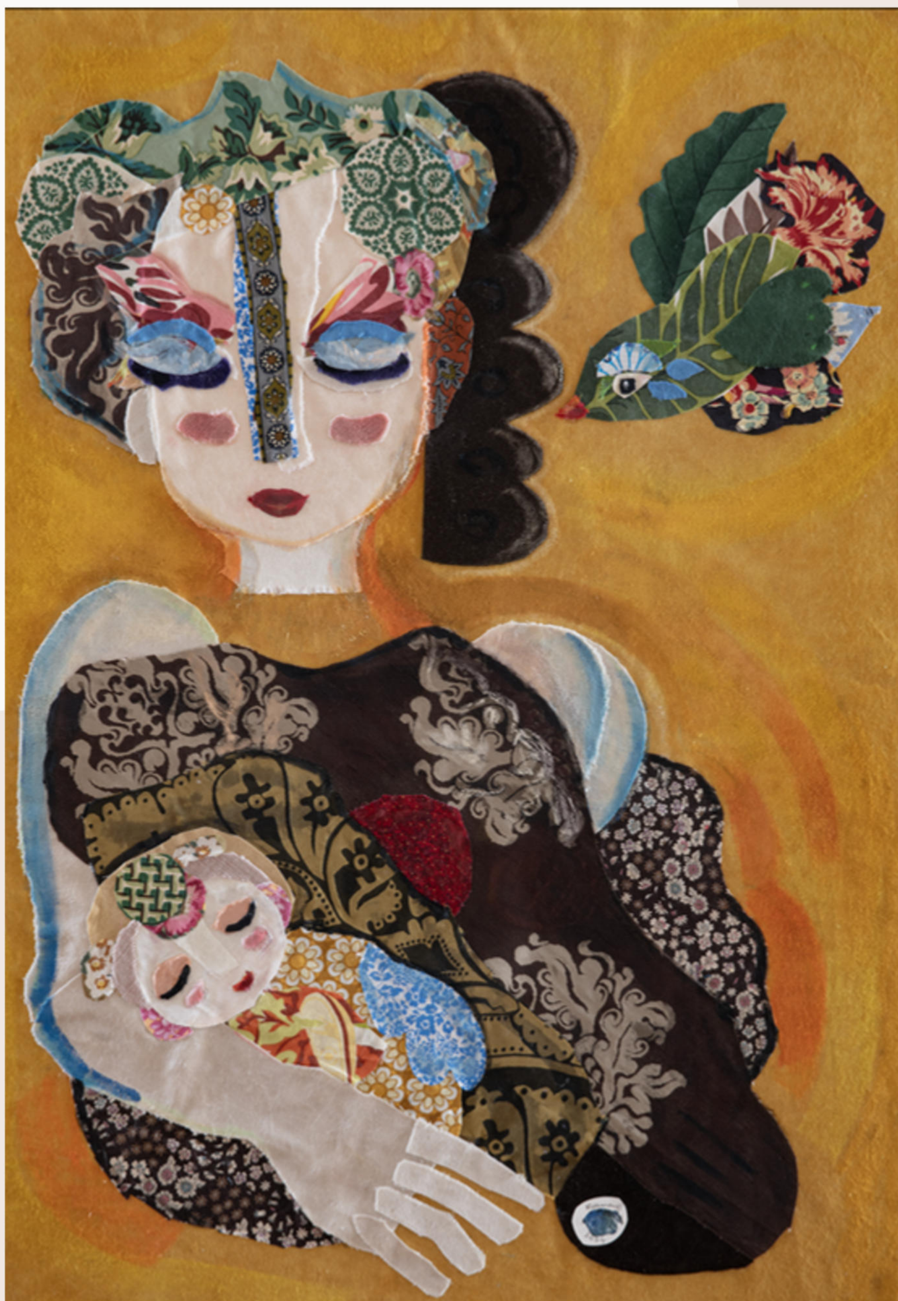
L'annonce de l'oiseau – 2024 Assemblages textiles et techniques mixtes 60x84cm