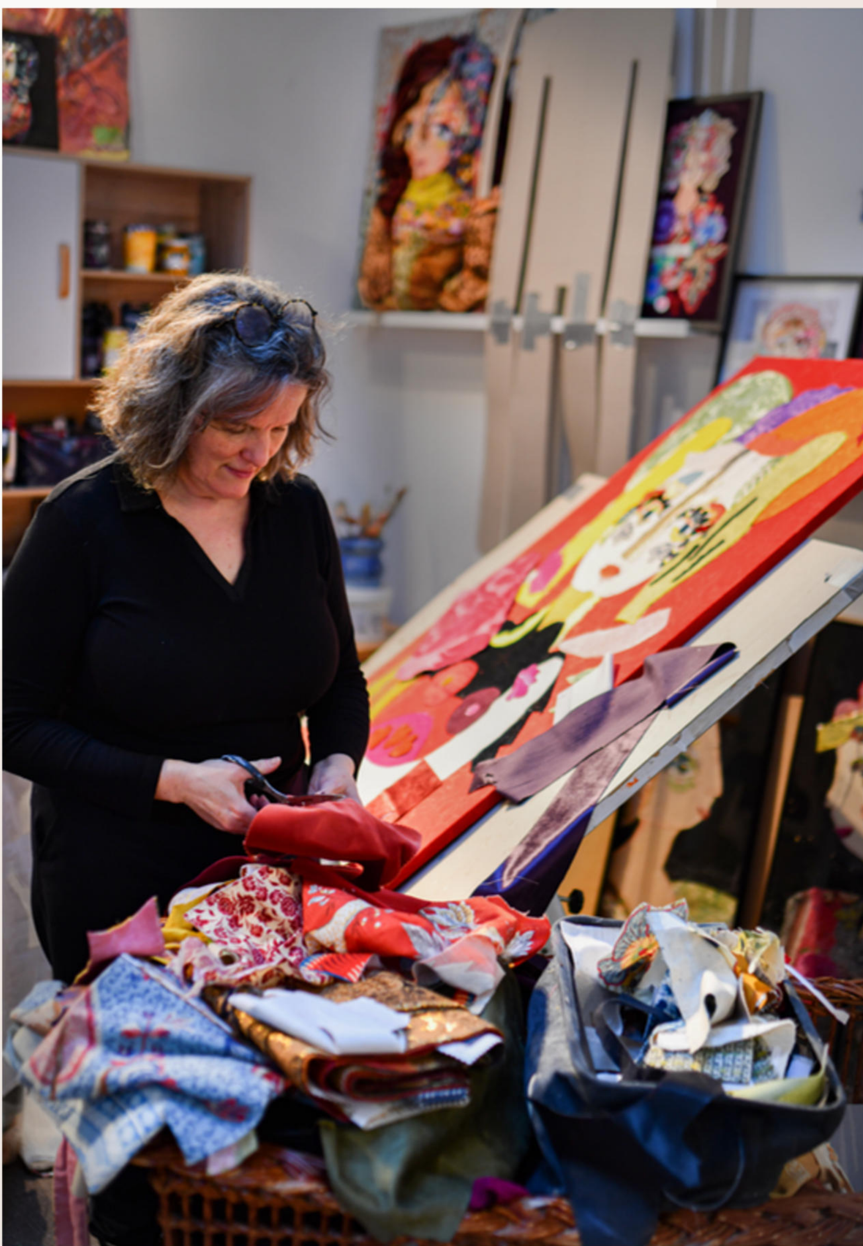
L'artiste dans son atelier - 2026 situé à proximité d'Angers (49)