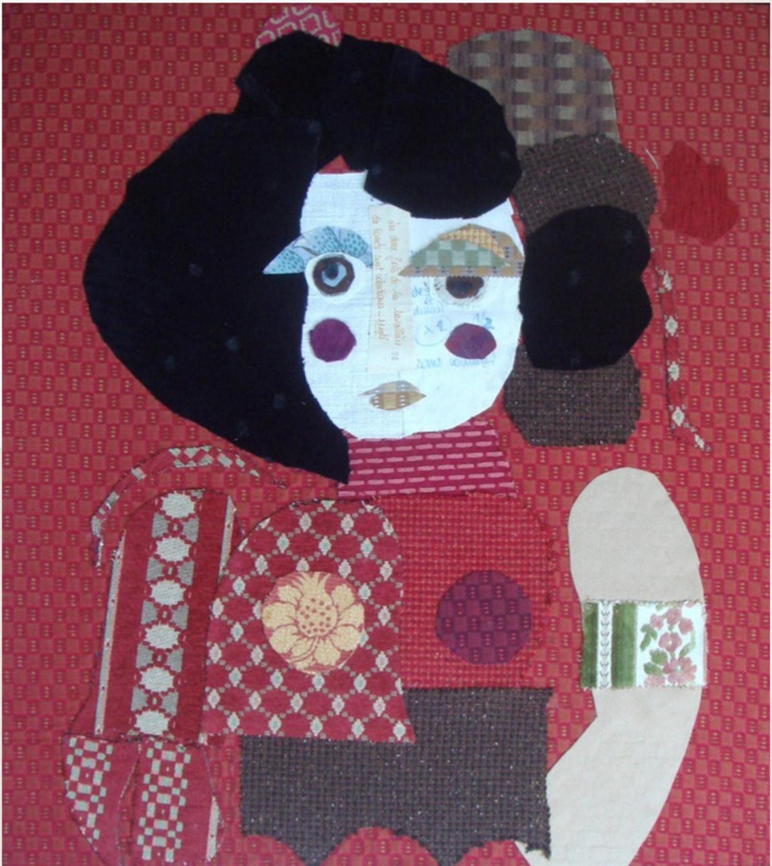
Le désespoir de la couturière - 2002 Assemblage textiles 60x80cm